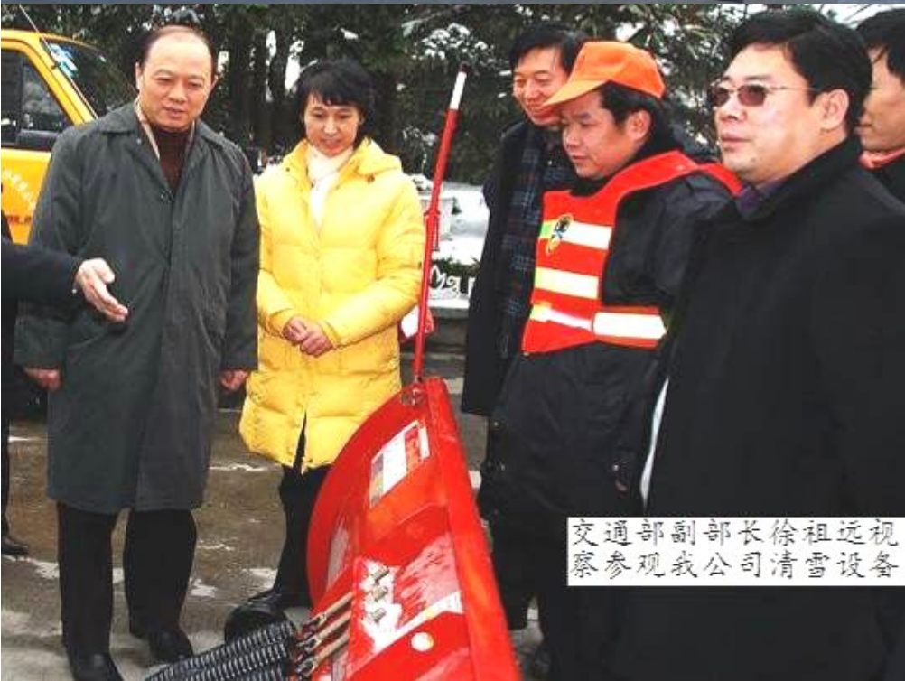
交通部副部长徐祖远视察参观我公司清雪设备

优质卡车底盘挂装美国原装进口专业高速除雪铲。如需要，同一套挂接点也可以快速转换挂装液压驱动滚刷。用户可以选择 4-5 立方融雪撒布机，如需要更大容量，可选最新式翻斗撒布机。总体布置采用符合人机工程设计原理，控制器、显示器布局合理，操作简单明了。所有除雪设备控制均可在驾驶室内有驾驶员一人在行进中完成调控。