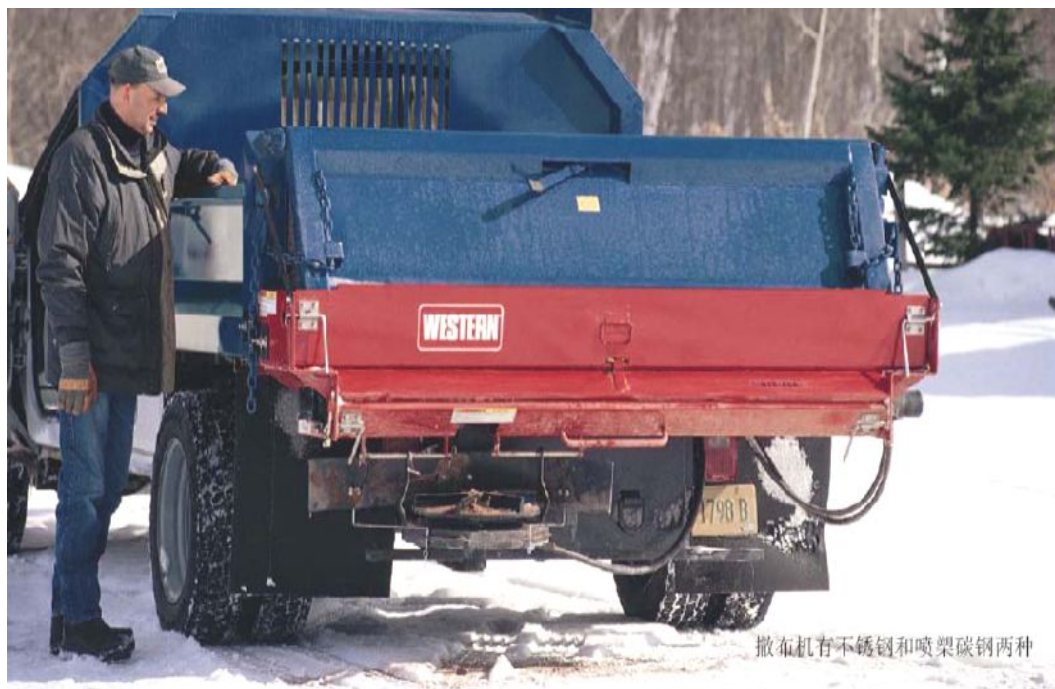
撒布机有不锈钢和喷梁碳钢两种